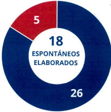
CANTIDAD DE PERSONAS DENTRO DE INFORMES