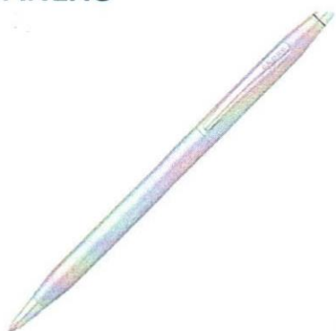
Item No. 2